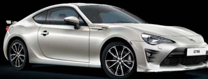
K1X Crystal White Pearl*