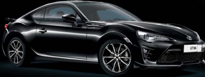
D4S Crystal Black*