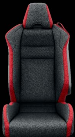
Stoff, schwarz und rot, mit roten Nähten Option auf Sport