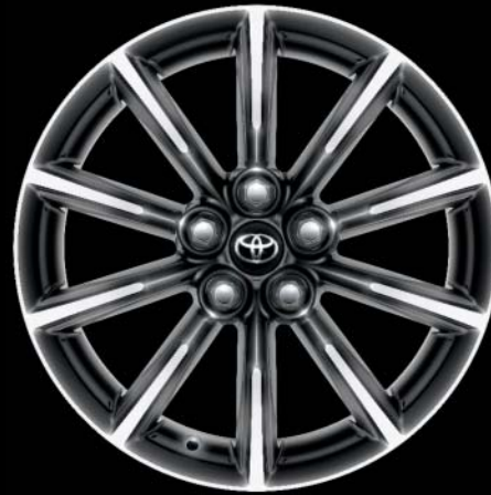
16"-Leichtmetallfelgen (10 Speichen) Standard auf Race