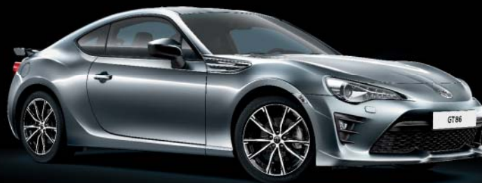
G1U Ice Silver*