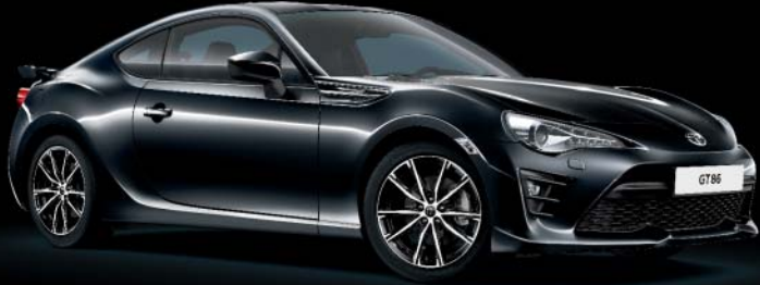
61K Dark Grey*