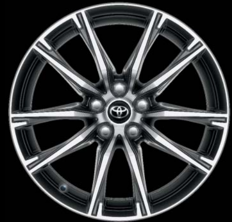
17"-Leichtmetallfelgen (10 Speichen) Standard auf Sport