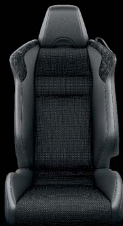
Alcantara®, schwarz, mit silbernen Nähten Option auf Sport