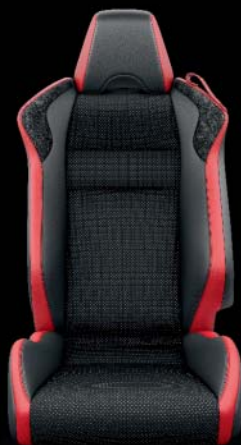
Alcantara®, schwarz und rot, mit roten Nähten Option auf Sport