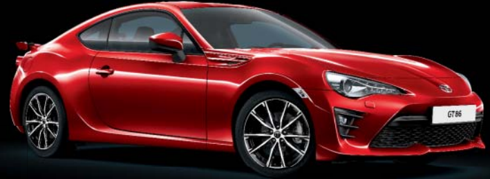
M7Y Pure Red