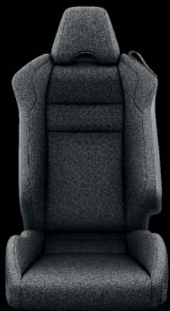
Stoff, schwarz, mit silbernen Nähten* Standard auf Race und Sport