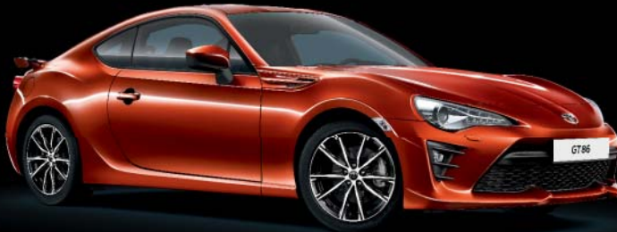
H8R Fusion Orange*