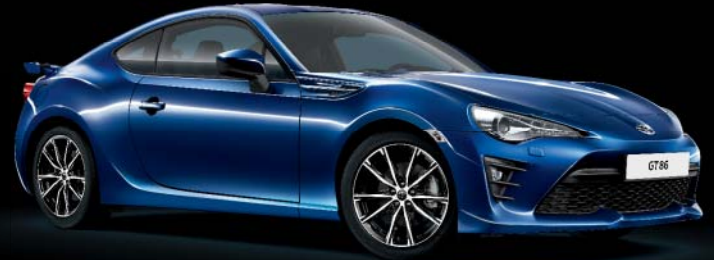
K3X Lapis Blue*